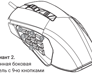
Вариант 2. Сменная боковая панель с 9-ю кнопками